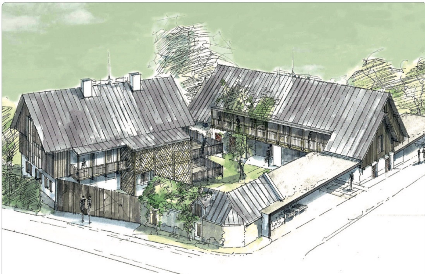
Vorentwurf - design by Helmut Perner